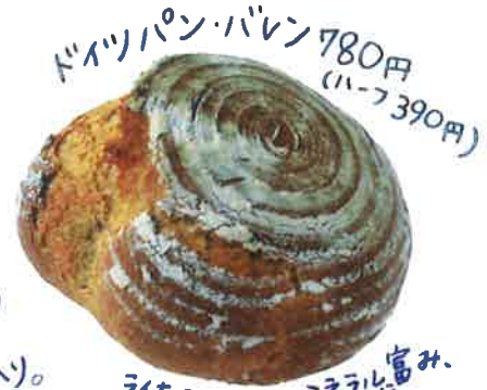
ドイツパン・バレン 780円 (ハーフ) 390円