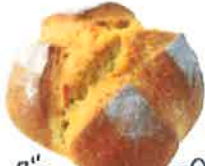
グラハムパン 330円 ヘルシー! 食べやすいです