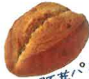
胚芽パン 310円 和のおかず、洋のおかずどちらにも よく合います!