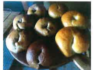
胚芽 麦パン 260円 プリン・キャロット・グラハム クリーム 290円 もちもちベーグルです!