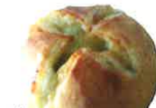
クリームチーズパン 330円 とても人気者!