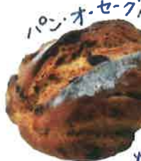
パン・オ・セーグ 550円 ライ麦生地 クリーム 白ぶどう! しっとり こんがりハードに 焼きあげています!