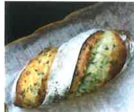
ゴマフランス 360円 外側はパリッと! 香ばしいです。