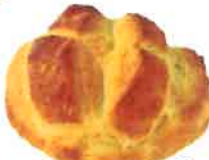
ブルーベリー 330円 シンプルでもちもち!