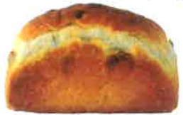
レーズン山食 500円 天日干しの白ぶどう(おはし)