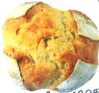
カンパネオ 680円 (ハーフ) 340円