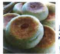
季節限定 金時豆パン 280円 洗双糖で煮ています。 ほくほく!