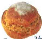
ライ麦パン 360円 ライ麦50%入り。西酵母の 酸味とほくほくモチ!