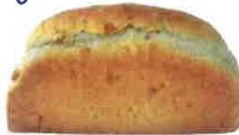
クリーム山食 520円 オーガニッククリームが 香ばしい!