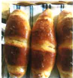
塩クッキー 10 230円 もちもちおはし!