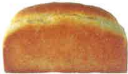
グラハム山食 450円 国産全粒粉分50%入り! ヘルシーです