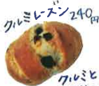
クレミレーズン 240円 クレミと レーズン 最高のコンビ!