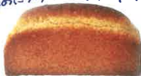
胚芽山食 450円 かみしめるほど甘い 味わえます。